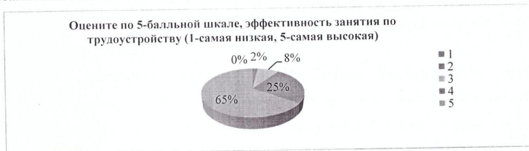
Рис. 2 Эффективность проведения занятий «Основы трудоустройства» по пятибалльной шкале.

Таким образом, как отмечают студенты, занятия помогли научиться правильно составлять резюме, применять различные способы поиска работы, вести себя на собеседовании с работодателями, также спланировать шаги в профессиональной деятельности. В своих пожеланиях большинство студентов предлагают устраивать встречи с работодателями для обсуждения вопросов, касающихся их специальности, подробно рассмотреть трудовой кодекс, проводить лекционные занятия отдельно по группам, также увеличить часы проведения занятий «Основы трудоустройства», кроме того, студенты оставили много положительных отзывов с пожеланием удачи преподавателям.